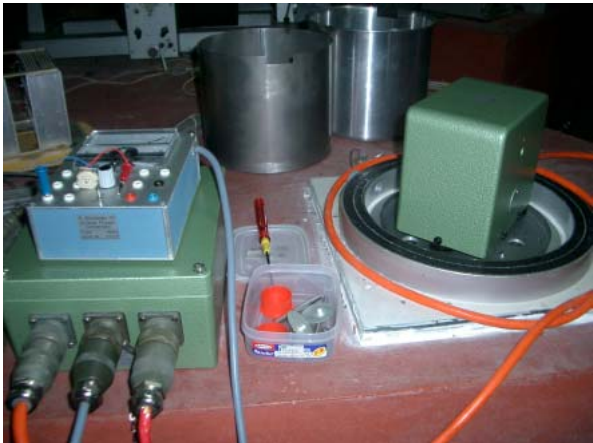
写真3 地震計調整風景（右：地震計、中央奥：中蓋、左上：調整機器、左下：フィードバック回路）

12月9日、10日の2日間かかって地震計3成分のオフセット調整が無事終了した。観測所による現地収録ではなく、以前から取り組んでいた電話回線でデータを送る方法を、地元電話局に再度確認したところ意外と簡単にできることが分かり、次回訪れる予定である2004年8月頃には電話回線でPHIVOLCSに送られ、ホームページに掲載することが可能となった。