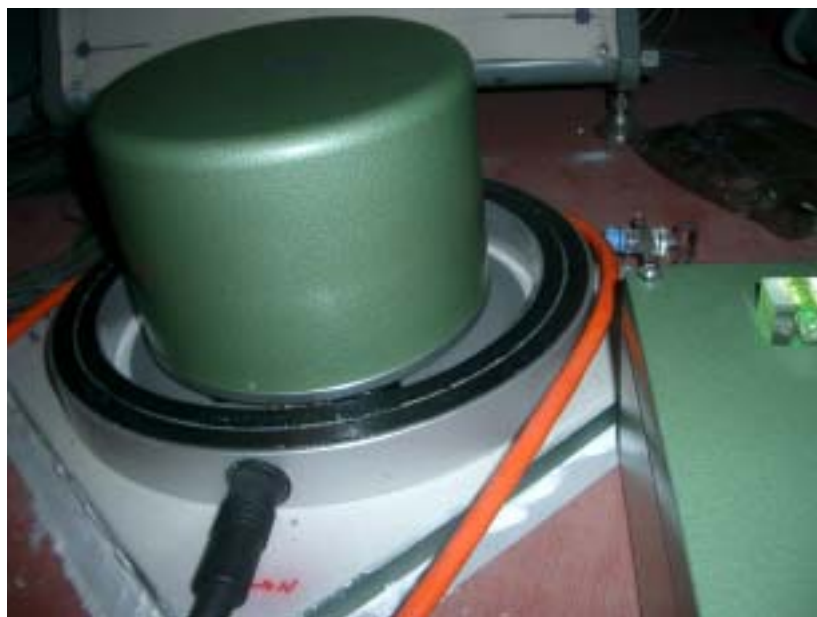
写真2 STS-1 広帯域地震計 (中から地震計、アルミ中蓋、鋳物中蓋、鋳物外蓋)

図3にタガイタイ観測点に設置された広帯域地震観測システムを示す。バギオ観測点にはバージョンアップされたシステムが導入されている。また、地震計は写真2に示す STS-1 が使用されている。今回の保守は、STS-1 のオフセット調整が主な作業である。