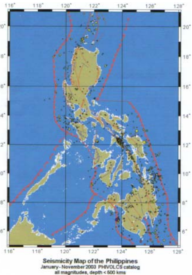
図2 フィリピンにおける地震活動

12月9日朝9時頃バギオ観測所を目指してPHIVOLCSの官用車で出発。余談ではあるがドライバーの運転には驚かされる。上手と言えはそうなのだけど、3車線の道路であっても5列に入り込みジグザグと車の間をすり抜けるようにして前に出る。前がいなくなったらおよそ130kmのスピードで突っ走る。後ろに乗っていてもそのスピード感は恐ろしい味わうことができるのだ。フィリピンではスピード違反はないのだろうか。スリルと