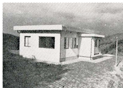
写真 1 旧観測所

観測所での仕事は、毎日の点検が重要な作業でした。地磁気の観測が行われていて、記録紙上に毎日の時間打ちとキャリブレーションを入れる作業、時々インクの補充と 1 ヶ月毎に記録紙交換を受け持ちました。温度と気圧の観測も行われ、1 週間毎に記録紙の交換もありました。採用試験の時、鳥取支所の初代所長であった一戸時雄先生に「頭は良くないですが、休まずにがんばります」と答えた言葉を思い出し、必死で観測所通いをしてたように思います。毎日の点検作業を終えて、鍵をまた宮腰先生宅の牛乳箱に戻して一日が終る日課が約 5 ヶ月続きました。採用試験の時、一戸先生が、「今日の記録は今日だけしかない」と言われた言葉が、観測所勤務という仕事の基本を言い表わしていた事に 40 年経った今ようやく気が付いたように思えます。なんでこんな山奥の人家もない、なんで墓地の中での仕事があるのか。墓地の中だからボチボチ歩けばいいのだが、そんな余裕なんぞどうも無い。あの 5 ヶ月間は、何もわからずただ必死に観測所通いをしていたのだと改めて思える今日この頃です。現在は墓地の中を歩いて観測所まで行く楽しみさえ覚えてきたようにも思えます。