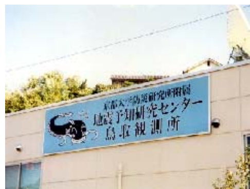
写真2 新観測所と看板