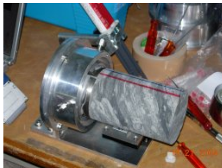
写真 13 治具