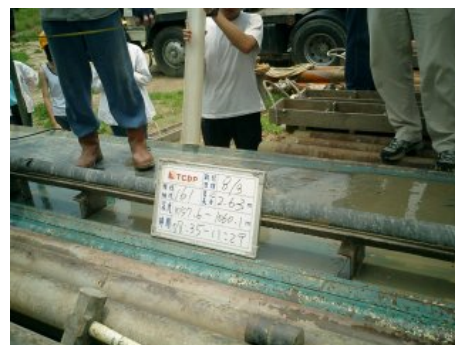
写真 6 写真撮影