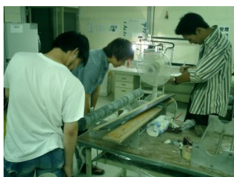
写真 9 目視による観察