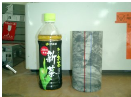
写真 12 供試体 (岩石コア)

測定には、写真 13 のような治具を用いて供試体を固定し、接着剤が硬化するまでの数分間放置する。測定は、写真 2 のように、最初、初期設定を PC でしておけば、自動で測定と簡易解析を行う。