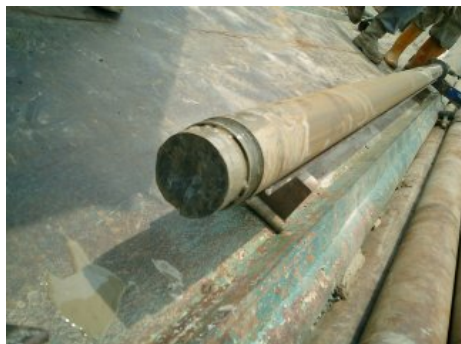
写真4 掘削された岩石コア