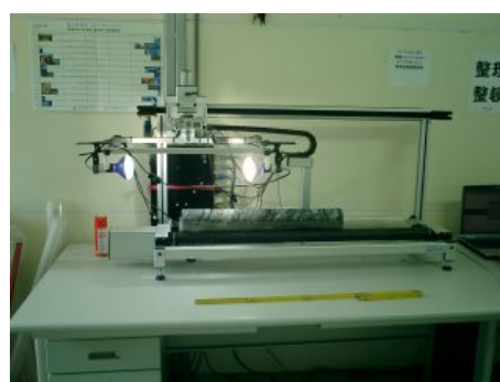
写真 10 写真保存