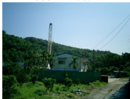
写真3 車籠埔断層掘削サイト

車籠埔断層掘削サイト（写真3）では、直径約83mmの岩石コアを掘削し、その岩石の表面観察により地質学的情報を記載し、風化等による劣化を防ぐ形で保管している。以下にその作業の流れを報告する。