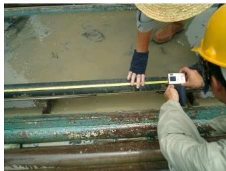
写真 5 岩石コアの測長