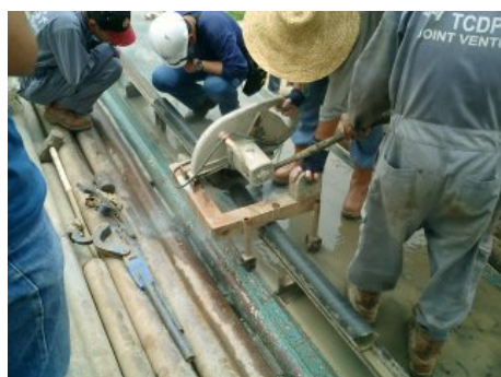
写真 7 切断