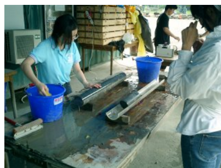
写真 8 洗浄