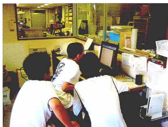
パソコンを使ってデータ処理、他