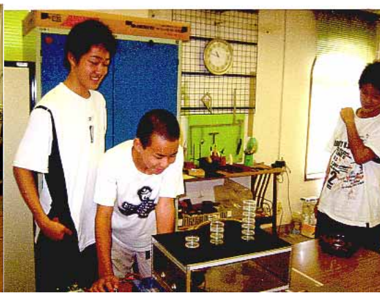
高さの違いによる揺れの違い