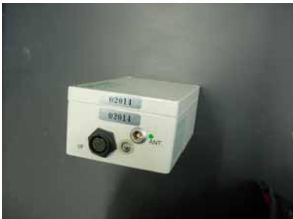
1 . LS-8200SD