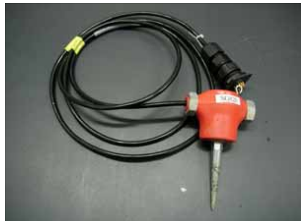
2 . SG820