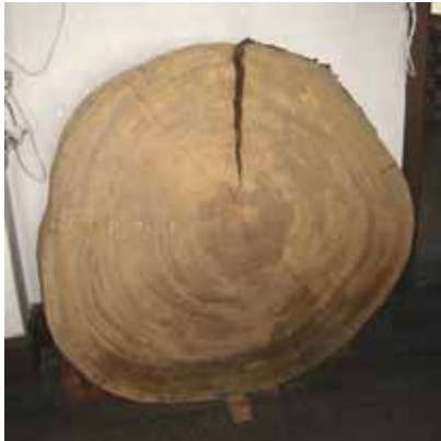
写真 22. 杉の輪切り