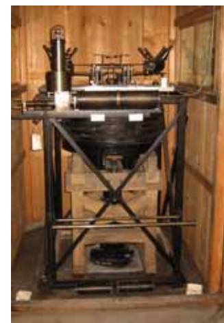
写真4. ウィーヘルト地震計 (水平動)

煤紙に細い針先で線を描いて記録された地震記録をニスの液中を通過させる事によって煤を定着するのに使用した。インク描方式に替わり使用しなくなった。