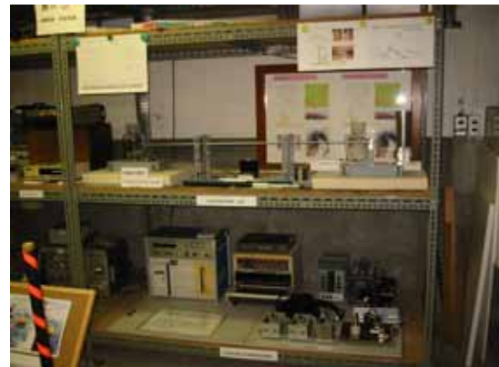
写真10. 地殻変動観測機器(上段)と最近の地震観測機器(下段)

ガリチン地震計は、ロシアのポリス・ガリチン(1862-1916)が作った地震計で、電磁式地震計としては最も古く1890(明治23)年頃作成され、そののち、ウィリップの改良したガリチ