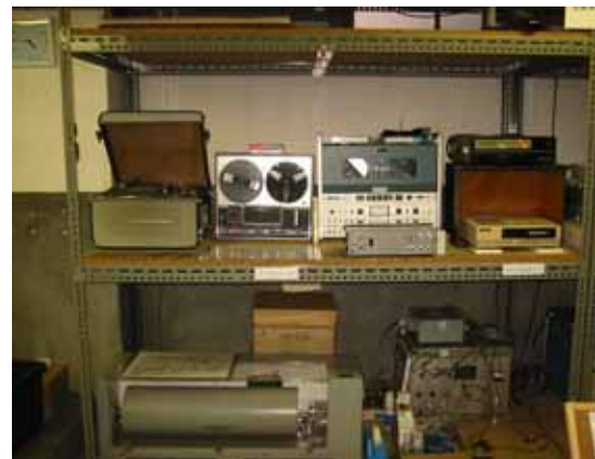
写真 9. データ収録機器(上段)と短周期

1960(昭和 35)年代から 1980(昭和 55)年代に、かけて用いられた。DR(Direct Recording)方式、FM(Frequency Modulation、周波数変調)方式、等のアナログ方式テープ・レコーダーで、臨時観測等で連続記録の他、アナログ遅延装置及びトリガー装置と組み合わせて、イベント・トリガー方式でも用いられた。