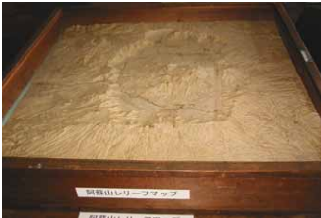
写真 19. 阿蘇山レリーフ・マップ