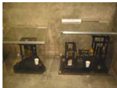
ガリチン式地震計