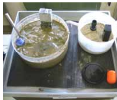
写真 15. 模型実験 液状化