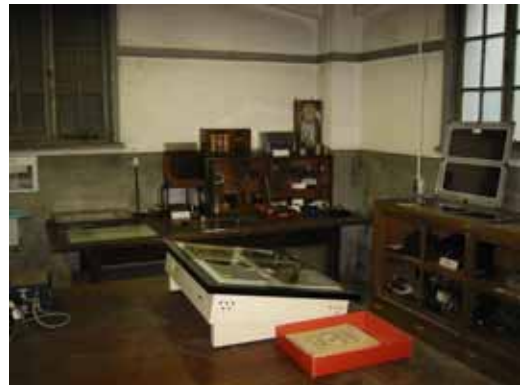
写真 5. 時計各種(上)と、昭和初～中