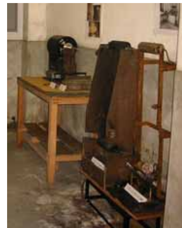
写真3. 煤・ニスかけ装

この場所には、ポスタ - (地震の始まり・近畿地方の歴史地震と活断層・南海地震)、カタログ(阿武山観測所1985年版 - 和文・英文と、地震予知研究センター2008年版 - 和文)、また、西南日本内陸部の地震活動図や近畿の活断層図等を掲示しており、見学者に地震の概要を説明する場とした。