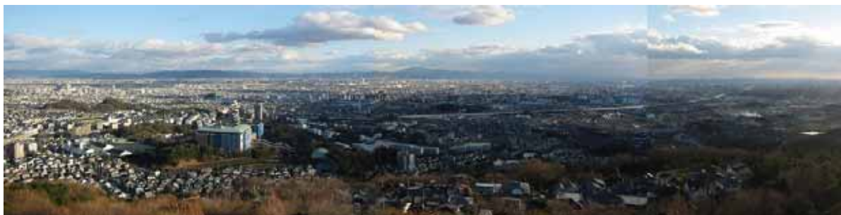
写真 24. 屋上からの眺望

以上、地階・3 階の展示を見学のあと、地上 35m 塔の屋上から大阪平野を一望(展望目当てに訪れる人も多い)して、見学を終了する。写真 24. は、塔の屋上からの眺望。