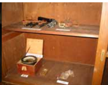
ハンドレベル・羅針盤・他