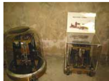
電磁式短周期 2 万倍微動計