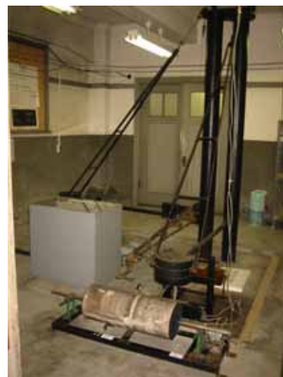
写真 6. 佐々式大震計