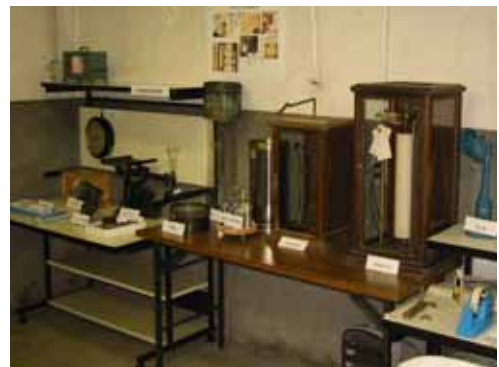
写真 8. 気象観測機器

かつて使用されていた、雨量計・温度計・湿度計・風向計・風速計・等々を展示。ただし、水銀気圧計は、ウィーヘルト地震計室の壁に固定してあるのでそのまま。すぐ横では、現在も観測を続けていて、ペン・レコーダやデータ・ロガーが稼動中。