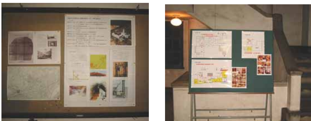
写真1. 阿武山沿革・他(左)と、見学順路の表示(右)

本館の玄関ホールに、阿武山沿革・大阪府の近代化遺産(建物)に取り上げられた文献、及び、地階・3階の展示内容と見学順路を掲示した(写真1)。