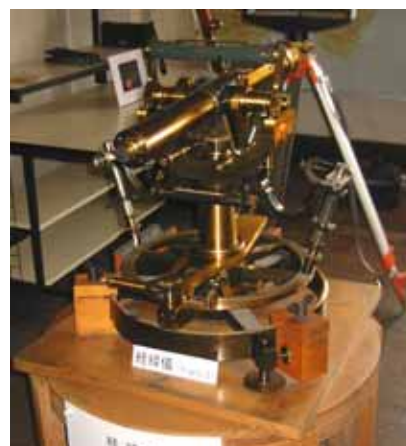
写真 16. 経緯儀

3 階には、測地関連機器・岩石標本・ほかを展示。 1980(昭和 55)年に、観測情報の総合化をめざして、測地測量(辺長・水準・重力・地磁気など)の分野の観測態勢が地震観測に付加された。地震活動に関連させながら、等重力測定、精密重力測定を繰り返し行なったり、活断層を中心にした辺長(距離)測量や、水準測量などが行なわれた。