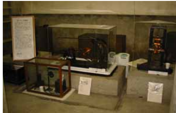
写真 11. ガリチン地震計一式

なかには、マグネットやコイルが取り外された地震計もある。また、名称不明の地震計やどのように使用されたのか不明な機器が数台ある。