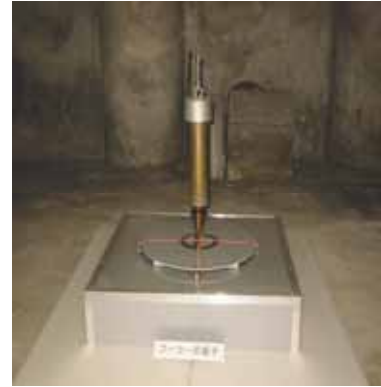
写真2. フーコーの振り子

見学順路の にしたのは、最初に振り子を振らしておけば、見学の終了時に地球の自転による振り子の往復運動の回転のずれを見学終了時に確認できるためである。