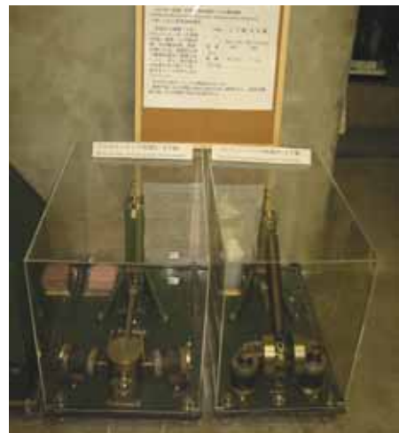
写真 12. プレスユーイング地震計