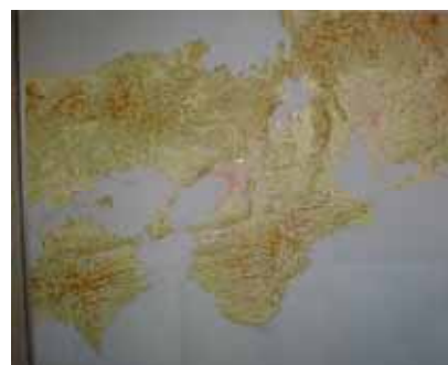
写真 18. 近畿地方の地図

阿蘇山のレリーフ・マップには、阿蘇の鉱石標本(皿石・阿蘇溶岩・など 18 種)も添えて展示。