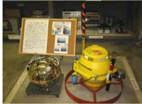
写真 14. 海底地震計

京大 IV 型海底地震計。1990 年代後半に地震予知研究センターで開発した海底地震計。水深 6000m の海底で約 1 ヶ月半の間観測をすることができる。直径約 40cm のガラス製耐圧容器の中に、固有周期 2Hz の地震計 3 成分、アンプ、16 ビット AD 変換器、リチウム電池、高精度時計等がコンパクトに収められている。地震波形データは MO ディスク(容量 2.6GB)に記録され、地震計を回収した後解析