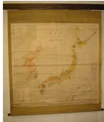
写真 23. 地質図

以上、地階・3 階の展示を見学のあと、地上 35m 塔の屋上から大阪平野を一望(展望目当てに訪れる人も多い)して、見学を終了する。写真 24. は、塔の屋上からの眺望。