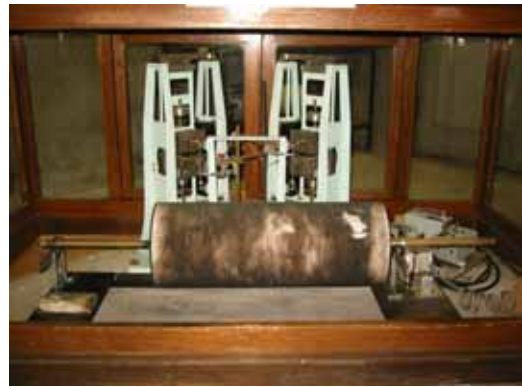
写真 7. 佐々式強震計(水平動)

1987(昭和 62)年 6 月に電磁式地震計(VSE 型・東京測振製)に代替し、記録方式もインク描き方式に変更。1997(平成 9)年 12 月末に観測を終了した。1983(昭和 58)年 5 月 26 日、日本海中部地震(M7.7)の記録や、大森式・今村式強震計の写真などの参考資料を掲示。