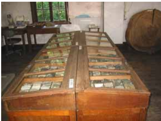
写真 21. 岩石・鉱物標本

火成岩(25種)、火成岩 火山岩(25種)、火山岩(50種)、変成岩 水成岩・古生代(25種)、水成岩・古生代 中生代(25種)、新生代(75種)、その他(60種)を展示。ほかに、越冬隊に参加した観測所の所員が持ち帰った、南極の石(ガーネット・サンド、他)を展示。また、岩石薄片(長石・ペグマタイト・他7種)も顕微鏡と共に展示。