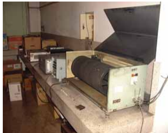
写真 3 記録ドラム(稼働中)

この頃の観測点は民家の敷地内(上那賀は分校の片隅)にあり、故障修理等に出向いた時にはお茶を出していただいたり、世間話をしたりと、つながりという意味では委託者と濃厚な関係が保たれ、ゆったりとした時間が過ぎていたかと思われます。