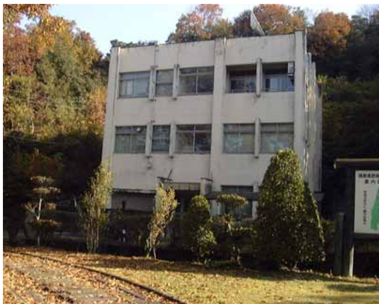
写真 1 徳島観測所

昭和47年10月16日付で京都大学理学部付属徳島観測所の技官として採用されて以来、36年余になります。時がたつのは早いもので実感としては地震観測に携わり、結果を振り返る時期が来た？何を？という感じです。まず、当初徳島には観測所は建設されておらず、1年半程は阿武山観測所で地震観測の基本を研修し、並行して徳島の観測点を捜しに行っていました。当時、明石大橋等は、まだ無く、淡路島経由か和歌山