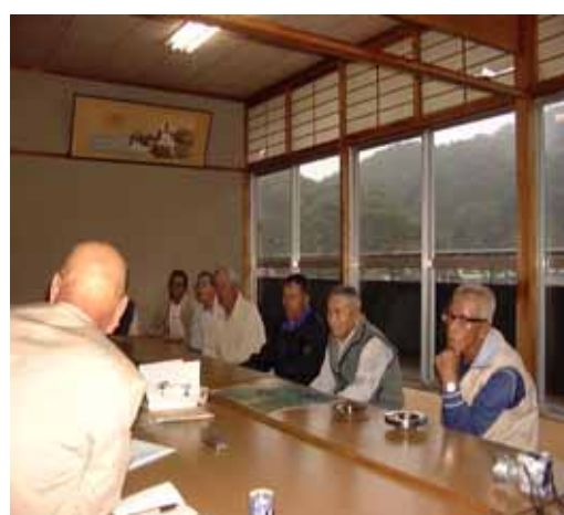
写真 7 聞き取り調査