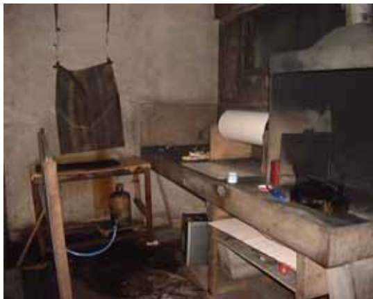
写真 2 煤書室(稼働中)

観測方法は、アンプにより増幅した波形及びタイムマークを、煤をかけた記録紙に記録し、毎日ほぼ定時に取り替えニスにより定着させ保存する(写真2)。地震計は、本所(石井)は60m、他の3点は5mの横穴式のトンネルの奥の岩盤上に置いてある。固有周期：1秒で、観測点は上下動一成分、本所は東西動・南北動を加えた三成分である。レコーダーの送りは毎秒4mmで、水晶時計の発振信号を増幅してモーターを駆動させて送り速度の安定化をはかった(写真3)。刻時信号は、時分秒信号とNHKの時報が地震波形に重ねて記録される。故障が発生した場合は電話連絡により状態を確認した後、こちらから出向くという方法をとっていた。