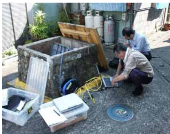
写真 6 データ収集風景

1946年12月21日に発生した昭和南海地震（M8.0）では、地震の前に紀伊半島から四国の太平洋側の広い範囲で地下水、特に井戸水の水位が減った、あるいは涸れたという報告がある。地下水観測が次の南海地震発生の予測のための情報が得られる手がかりになると考え地下水調査及び観測を行う、という趣旨で2003年7月に細元技術職員（当時）と2人で洲本市由良町及び徳島県海部郡周辺の井戸の調査を行った。この観測は2008年3月に担当教官が退職（梅田教授、重富助教、尾上助教）するまで続けられた。短期間のため当然ながら結果は出ていないがデータは残っているので、将来必要になるだろうとひそかに思っています。