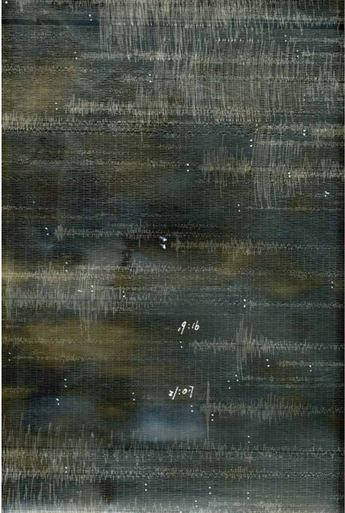
図 1 阪神大地震余震（煤書き記録一部分）