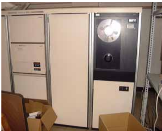
写真 5 テレメータ装置(廃棄予定)

記録は自局4点の上下動を煤書きドラムに、また各三成分12chを14chのアナログデータレコーダー(ADR)1に収録し、データ交換の成分はADR2に収めている。2巻のテープになったこれらの主な記録は1巻のテープに編集し保存している。地震の判別は、自局の4点と交換データ6点の計10点からなされ、ADRとPIOに起動信号が出力される。PIOから取り込まれた15点・33chの波形データは主に、集中記録装置からの判別情報により地震と判断されるとDISKに収録され、一定の条件を備えた地震に対しては直ちに自動読み取り・震源決定がなされる。この波形データは、グラフィックディスプレイ装置に自動読み取りの位置に印の付いた形で表示されるので、確認しながら手動験震する事になる。しかし、自動読み取りの位置が最大17msec程ずれるという問題があったので、1988年に処理システムが一旦破壊されて復旧した際に、すべての要素にカーソルを当てて読み取る方法に変更した。