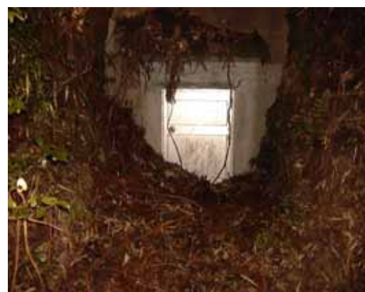
写真 4 鷲敷観測坑入口

写真4は、2008年12月に扉の鍵を修理しようと訪れた鷲敷観測点の、観測坑周辺の写真ですが、観測を中止して24年、見回りに行かなくなつて15年余、約50cmの土砂に埋もれていたため入口周辺の整地等に1時間かかり、業者の方が鍵をこわし(金ノコで切断)新しく取り付けた後、開閉出来るまでに土砂を取り除きました。トンネル内は思ったよりきれいな環境でしたが今後、使用して下さる教官はいるのかな?。無駄にならない様にと思いつつ作業をしました。また、同様に中止した池田観測点は5年前に鍵を修理し使用出来る状態になっています。