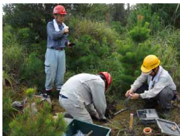
写真4 地震計設置風景