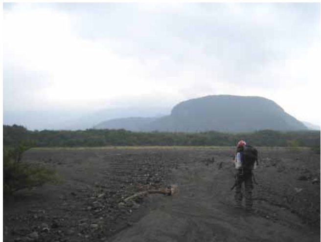
写真2 扇状地を行く