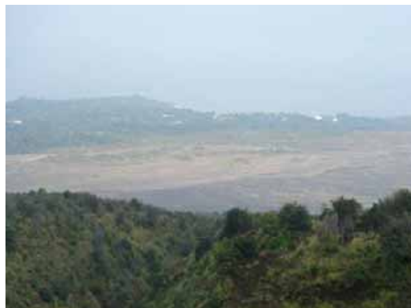
写真3 地獄河原と黒神集落

以前から聞いていた、桜島東部に広がる地獄河原を今回の行動で初めて見る事が出来、自然のなせる業に畏敬した。地獄河原は昭和火口からの溶岩流によって出来た溶岩原であったはずだが、今は昭和火口やその周辺の谷々からの土石流によって、火山灰の堆積した荒涼たる平原となっていた。その姿は衛星写真からも見てとれる。近くの黒神の集落を始め海岸域にある集落は小高い堤防によってこれらの土石流から守られていた。盛んに爆発する昭和火口から黒神の集落までの距離は四キロ弱との事、住むには他の土地もあろうかとも思うのだが、御岳と共にこれまで生活をして来た集落の人々の執念か、この島に住み続けることに人間の性なるものを感じた、今回はそんな出張でもあった。