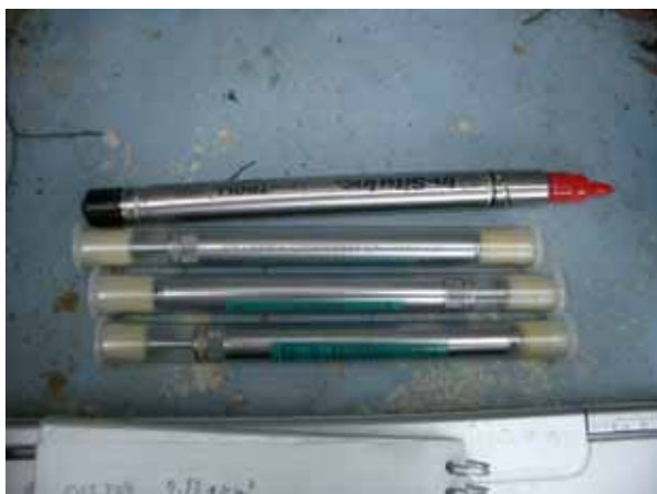
写真2 精密温度センサー

写真2で示すように、長さ20cm程度の持ち運び便利な精密温度計を海洋研究開発機構から借用し、写真3に示すように掘削日誌より171m付近に断層があるとのことで、断層前後は50cm間隔とし、借用した温度計20本全てを取り付け300m孔井に沈め連続観測を開始した。