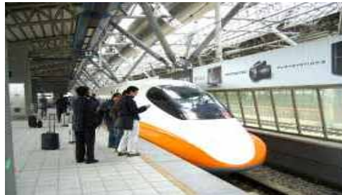
写真 4 台湾、新幹線（往路）