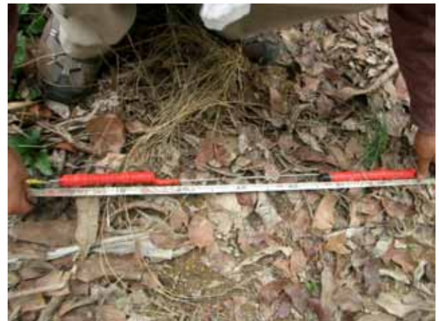
写真3 温度センサー取り付け間隔