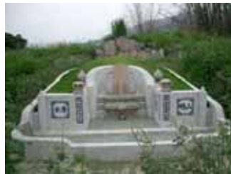
写真 6 墓地