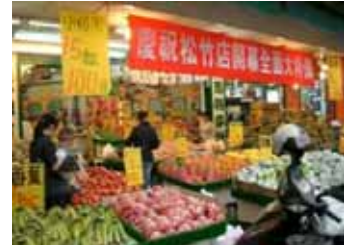
写真 7 果物屋