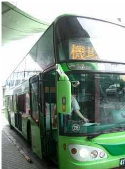
写真 5 台湾、バス（帰路）

最後に、アジア台湾は果物（写真 7）の美味しい国でもある。多種の果物が店頭に並んでグラムで売り買いがなされていた。とにかく日本では知られていない珍しい果物があり、物珍しさのあまり著者も少し買ってホテルで食べてみたが、南国の味がしてとても美味しかった。