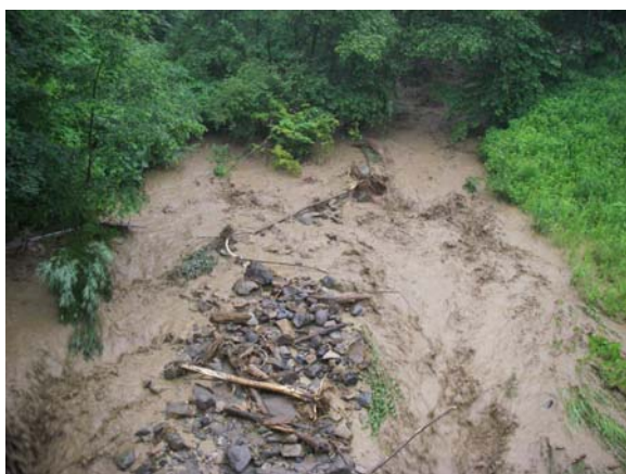
写真7 番外1：足洗谷水路上流部分

最後になりますが、宇治でのこの2年間本当に多くの方にお世話になりました。そして様々なご迷惑をおかけしました。ありがとうございました。また来年からもご迷惑等おかけする事もあるかと思いますがどうぞよろしくお願いいたします。