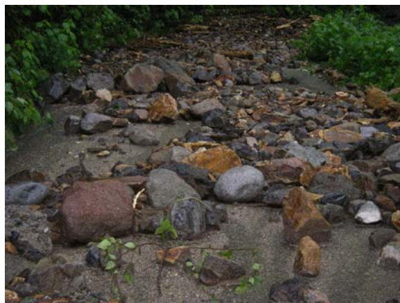
写真8 番外2：ヒル谷焼岳登山道方面