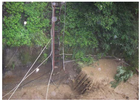
写真 3 足洗谷階段付近

足洗谷水路では、観測用水路まで降りる為の階段の地面が濁流によって削り取られ、階段が浮きあがった状態となり使用する事が出来なくなった（写真 3）。水路でも土砂等が詰まってしまった為、水の流れが変わり水路の両横が完全に掘れてしまった（写真 4）。この階段の側面や底にケーブルを這わせ水路の観測機器に繋いであったが、観測機器のほとんどは濁流に飲み込まれ千切れたケーブルだけが残されるという状況となった。水路の底に設置してあるハイドロフォンも傷つけられ、全ての観測機器が使えなくなってしまった。今回のように機器が無くなりケーブルだけが残されるという状態は観測時には比較的多いケースのトラブルになるかと思うが、私自身はこのようなトラブルに直面したのは初めてであった為少し驚いた。