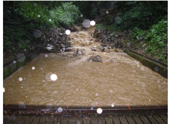
写真 6 ヒル谷試験堰堤

観測用水路とは別に、観測所に近いヒル谷試験堰堤でも大量の土砂が流れ込み限界まで溜まってしまった（写真 6）。この試験堰堤は年 1、2 回程度の排砂作業を行っているが、この土砂流出が起きる 1 週間前に 1 度目の排砂作業（ヒル谷試験堰堤土砂排砂実験）を行ったばかりであった。その為観測所としても珍しい排砂作業を 1 ヶ月で 2 回行う事が決まった。排砂作業には参加出来なかったが事前準備等を行った。また排砂作業は翌週、学生に観測所へ来てもらい作業が行われた。