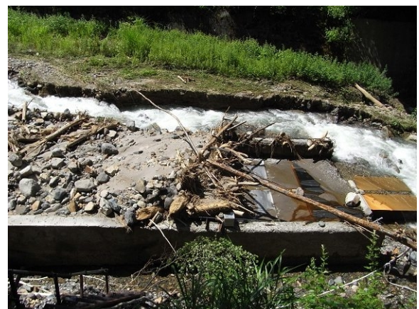
写真 4 足洗谷観測水路（左：被災前 右：被災後）