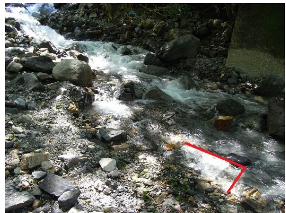
写真 5 割谷観測水路（左：被災前 右：被災後）

割谷水路では、水路付近は被災前とは完全に変わってしまっていた（写真 5）。またハイドロフォンの一部分以外が埋まってしまう現場の写真の撮影時にはどの場所にあったのかを探し出す所から始まった。水路周辺全体がほとんど変わってしまっている為、ハイドロフォンを探し出す事や被災前の写真と同じ位置からの撮影に苦労した。実際には少しハイドロフォン寄りの位置から撮影を行った。写真 5 に引いている赤いラインがハイドロフォンの位置である。またハイドロフォン以外にも濁度計等の観測機器が足洗谷水路と同じようにすべて流されてしまった。割谷水路の少し下流では流されたケーブルの一部が発見された。