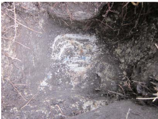
写真2 埋められた水準点