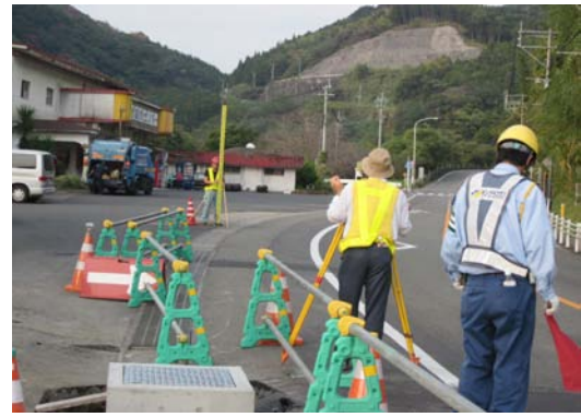
写真3 水準点移設接続測定