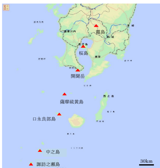
図 1. 鹿児島県内主な火山

桜島火山観測所では桜島の観測だけでなく、南北 600 キロにも及ぶ広い鹿児島県に点在している離島火山においても、さまざまな観測を行っている（図 1）。観測対象として薩摩硫黄島、口永良部島、中之島、諏訪之瀬島などがあり、これら以外にも屋久島に観測点を設けている。今回は、これらの離島火山における観測体制について簡単に紹介したい。