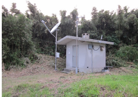
図 3. 諏訪之瀬島観測室 観測室前にあるのが VSAT アンテナ

諏訪之瀬島の中央にそびえる御岳 (787m) は、桜島同様今も活発な噴火活動を繰り返している。現在、諏訪之瀬島には山頂部に 4 点観測点があり、各観測点から地震、空気振動、傾斜データを麓の観測室まで無線を使用して伝送し、そこから VSAT を使用して桜島火山観測所までデータ転送を行っている。諏訪之瀬島の山頂データは、観測点位置により、麓の観測室まで無線送信することができない 2 点に関しては、中之島へ無線送信してから中之島の VSAT 経由で桜島火山観測所まで送られてきている。麓まで送信できる観測点も一部無線 LAN で中継して、諏訪之瀬島観測室に設置している VSAT を用いて桜島火山観測所まで転送している (図 3)。