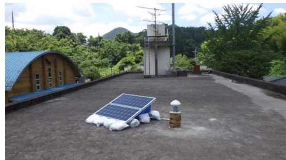
図 3 設置完了例