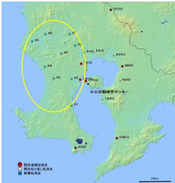
図 1 桜島島外で鹿児島県本土の GNSS 観測点丸で囲った地域が今回整備した地域になる

始良カルデラ下では、マグマの蓄積による地盤変動が観測されている。マグマ蓄積の進行を詳細にするために、GNSS 連続観測点の増強を実施する必要がある。京都大学防災研究所附属火山活動研究センターでは、1994 年以降、GNSS 観測点を整備してきた。2014 年の時点で、連続観測点数は、桜島島内外合わせて 27 点、繰り返し観測点数は 14 点となっている。2015 年に桜島島内にある、繰り返し観測点の 2 点を、連続観測化し、さらに 2016 年に始良カルデラ周辺の西側地域において、連続観測点を 10 点、整備したので報告する (図 1)。