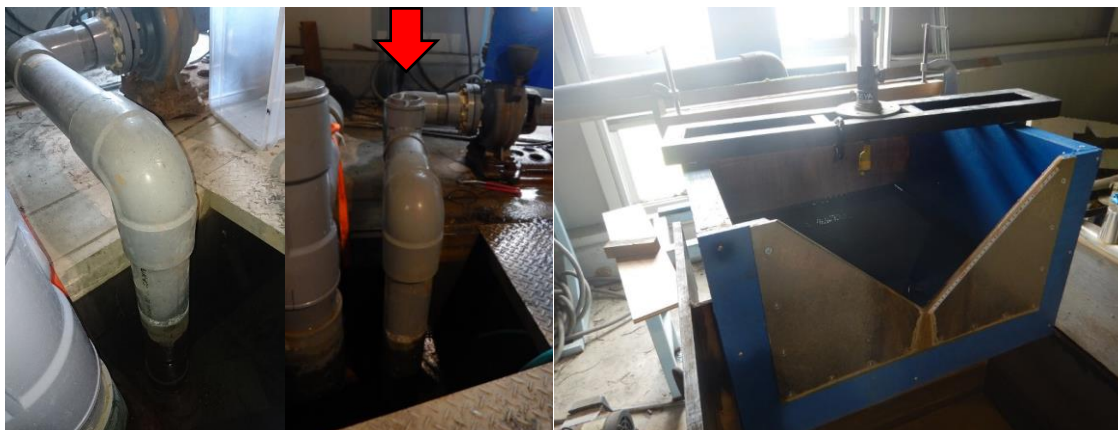
写真1 ポンプ配管前（左）後（右）

最初に、ポンプはフート弁（逆止弁）に不具合があるケースが多く、水が上がらないことがあるので、呼び水をしやすいように配管します（写真1）。ここでは、ポンプ吸込み方向の塩ビ管に掃除口を取り付けています。高水槽は老朽化が進み、水漏れしている箇所があるのでシーリングします。それでも改善しないときは一から作り直します（写真2）。実験水路部は目的に合うように作り変えます。水路部の構造は直線型や蛇行型などがあり、河床条件も固定床や砂が敷き詰められている移動床など実験によって異なるので、それに合わせて作り変える必要があります（写真3）。出来るだけ実験の際に学生に負担がかからない構造にするよう心掛けています。砂を使用する実験では砂が帰還水路に入らないようにするために低水槽に砂受けを作ることもあります。