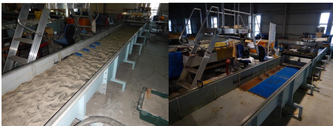
写真3 水路部改修前（左）後（右）