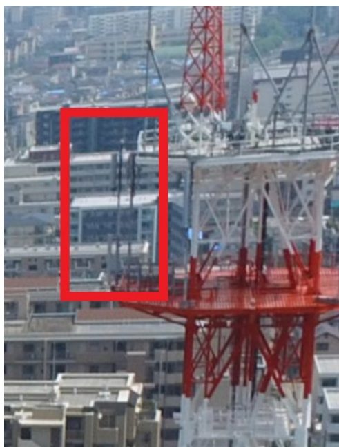
写真 2 携帯基地局アンテナ