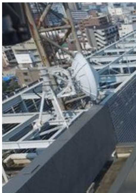
写真 3 パラボラアンテナ