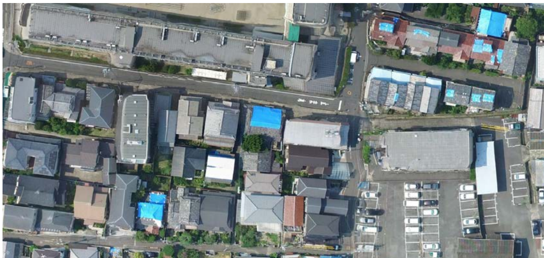
写真 4 オルソ画像の一部