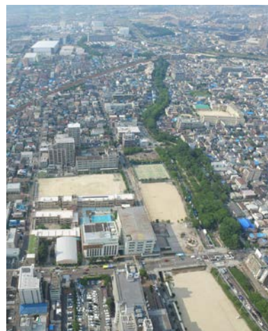
写真 1 市役所から北側の様子