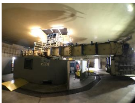
世界最大の遠心载荷装置