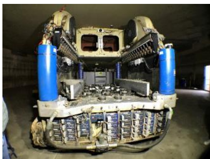
プラットフォーム正面