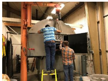
試験体を設置する様子