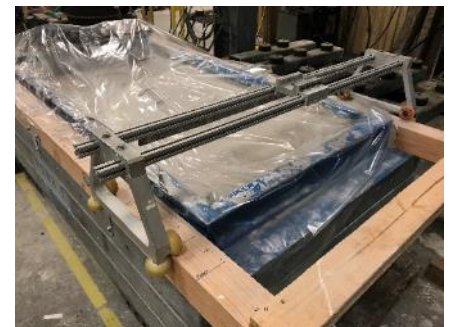
デプスマーター用レール