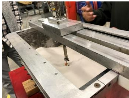
センサーを所定の深度に置く