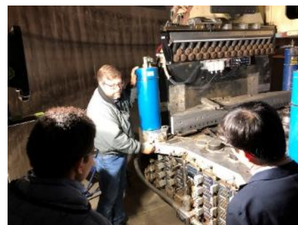
振動台の説明を聞く