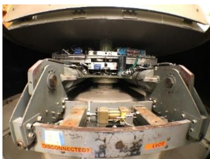
小型遠心のプラットフォーム

超巨大遠心のほかに、UCD には有効回転半径 1m の比較的小型な遠心载荷装置がある。模型寸法に制約があるものの扱いやすく、基礎的なパラメータを調べるための実験に使用される。LEAP の一連の試験もこの小型遠心で実施されてきた。2. 実験技術では LEAP に関する実験技術について報告する。