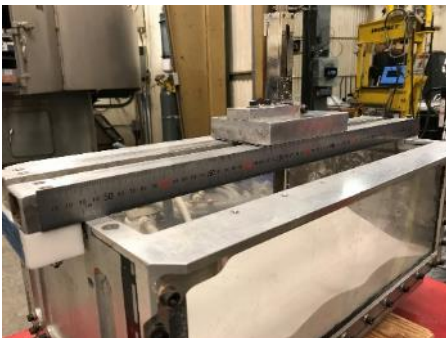
デプスマーターを用いた道具