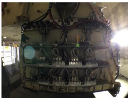
プラットフォーム側面