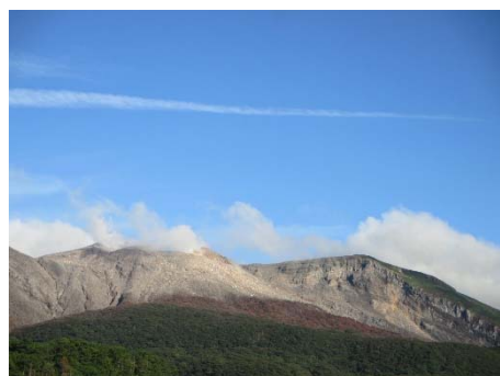
図1. 2014年8月13日噴火後の口永良部島。撮影日は2014年8月21日。火砕サージが流下した山林は茶色に変色している。

口永良部島は、屋久島の西方14kmに位置する火山島で、記録に残されている最古の噴火は、1841年である。その後、1933年から1934年の噴火活動にはじまり、1945年には、新岳火口東外壁で割れ目爆発、1968年から1969年の噴火活動、1976年に新岳山頂火口で爆発、1980年には新岳東側の割れ目から水蒸気爆発が発生している。近年においては、2014年8月13日に新岳山頂火口より水蒸気爆発が発生し、新岳火口から概ね1kmの範囲に火砕サージが流下し、山林に被害が生じた（図1）。また翌年の2015年5月29日には、新岳山頂火口よりマグマ性爆発が発生し、噴煙の高さは9000m以上に達し、新岳火口西側斜面においては、前田集落近傍の向浜付近に達する火砕流が発生した [1] （為栗・他2016）。この時の噴火を受け、噴火警戒レベル導入後初のレベル5が気象庁から発表され、口永良部島の住民は、全島避難となった。その後、6月18日にも島外まで火山礫を飛ばす、大きな噴火を起こしている。また、2019年1月17日と29日にも火砕流を伴う噴火を起こしている。そして、2020年2月3日の噴火でも噴煙の高さは6000m以上に達し、火砕流も発生している。