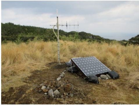
図4. 2015年1月設置臨時地震観測点

うので、少しでも山頂に近づける場所を選定し、2015年1月に新規地震観測点を設置した(図4)。また同時に、2014年8月3日の噴火以降、口永良部島の地盤変動状況を確認するために、GNSSキャンペーン観測の実施、短い期間内に、水準測量を繰り返し実施してきている。