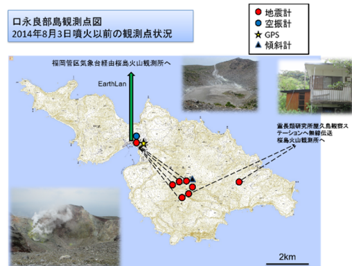
図3. 2014年8月3日口永良部島火山噴火前までの地震観測点図