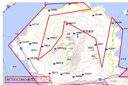
図.4 モバイル通信エリア（4G）