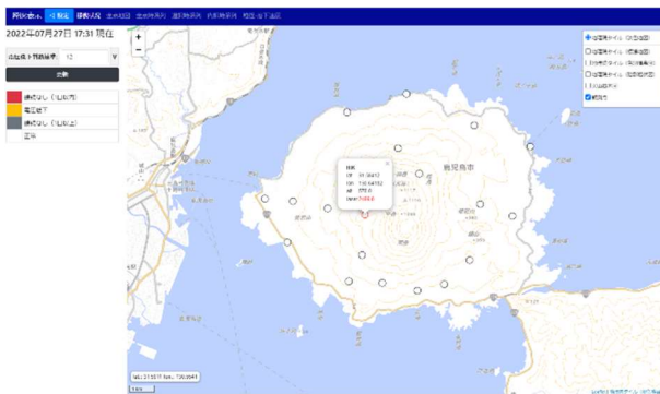
図.6 降灰表示 Web ページ①

一時間毎に観測データが伝送されてくるので、まとめて確認できる Web ページを構築している。観測データには、電源電圧、降灰及び降水データ、Parsivel2 のセンサー精度を表すレーザー値などが含まれており、それぞれ Web ページ上で確認することができる。