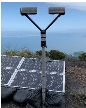
図.1 Parsivel2 外観

また、OTT社（ドイツ）製ディストロメータ「Parsivel2」を観測に使用している。