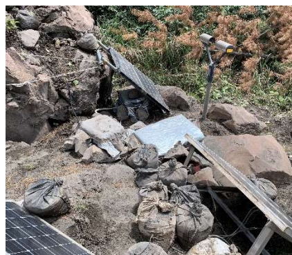
図.2 降灰観測点風景（鍋山観測点）