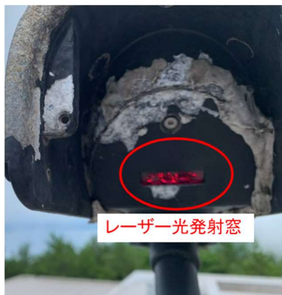
図.5 レーザー光発射窓に水滴が付着している様子