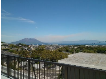
写真2.実家から望む桜島

幼少の頃より、漠然と「機械」というものが好きでラジコンの分解組立やプラモデルの改造などに夢中でした。その機械好きの性格もあり、九州大学工学部機械航空工学科へ進学しました。学部4年次には二重反転軸流ポンプ（翼が2枚あり、互いに逆回転する構造）の気液二層流状態の挙動に関する研究を行いました。その後、九州大学大学院総合理工学府、大気海洋環境システム学専攻へ進学し、数値シミュレーション（LES モデル）を用いた海面境界層の乱流状態の解析に関する研究を行いました。数値解析は初めての経験であり、まずはLESモデルの構成について学びました。モデルおよびプログラミングに慣れ、ようやく物理現象について深く研究を行える段階で卒業を迎えました。