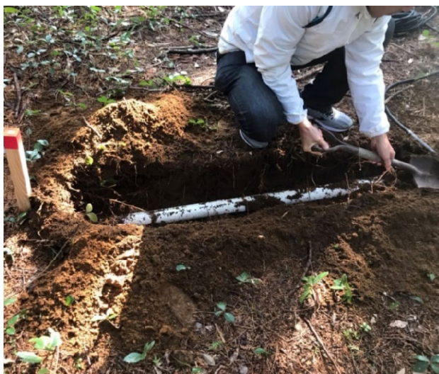
図3 磁場測定用センサー（南北）埋設時の様子