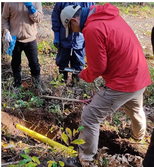
図2 磁場測定用センサーの方位調整