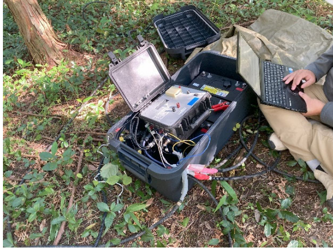
図 6 収録装置