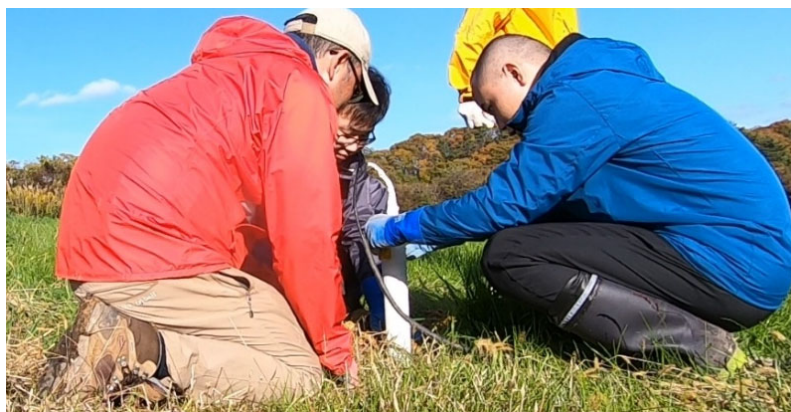
図4 磁場測定用センサー（鉛直）埋設時の様子