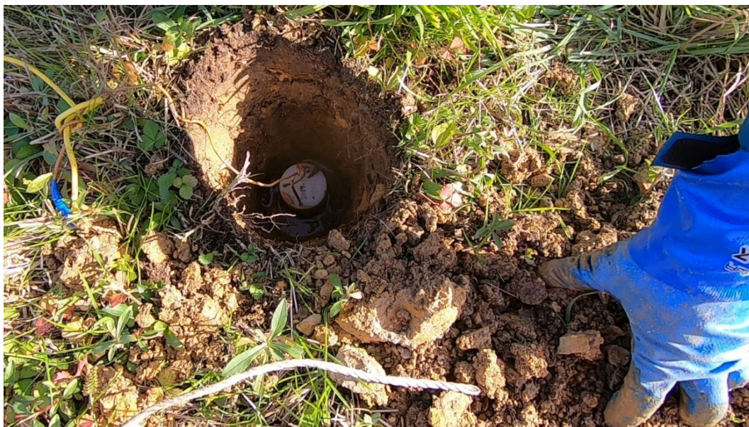
図5 電位測定用電極の埋設時の様子